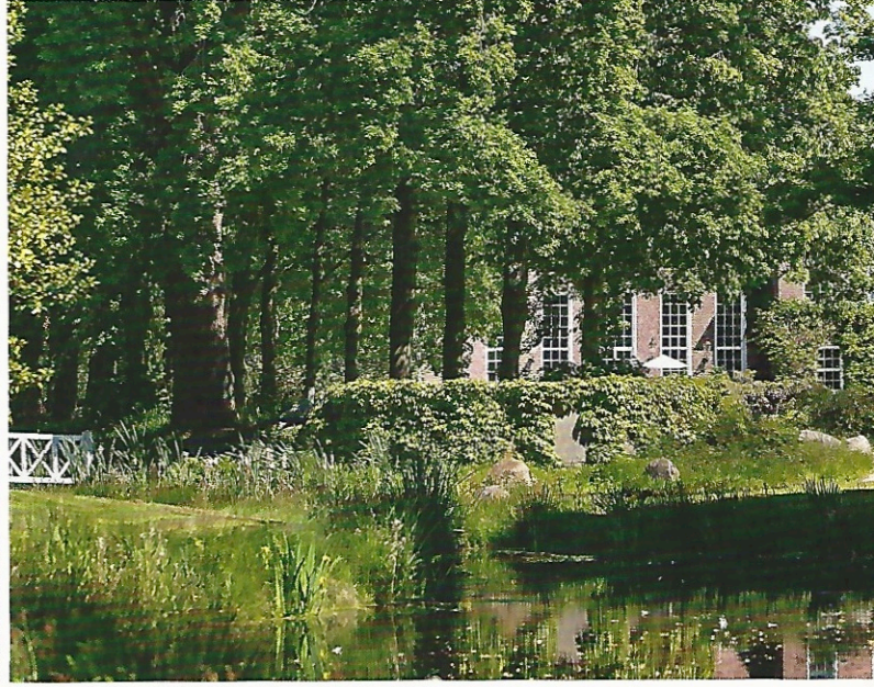
Rund um die Vorburg und das Wasserschloss pflügen Schafe den Rasen. Das Schloss wird von den Besitzern bewohnt und ist nicht zugänglich.

Im Schlosspark Lütetsburg ragen Rhododendren bis zu acht Meter hoch in den ostfriesischen Himmel, säumen Wege und spiegeln sich im Wasser.