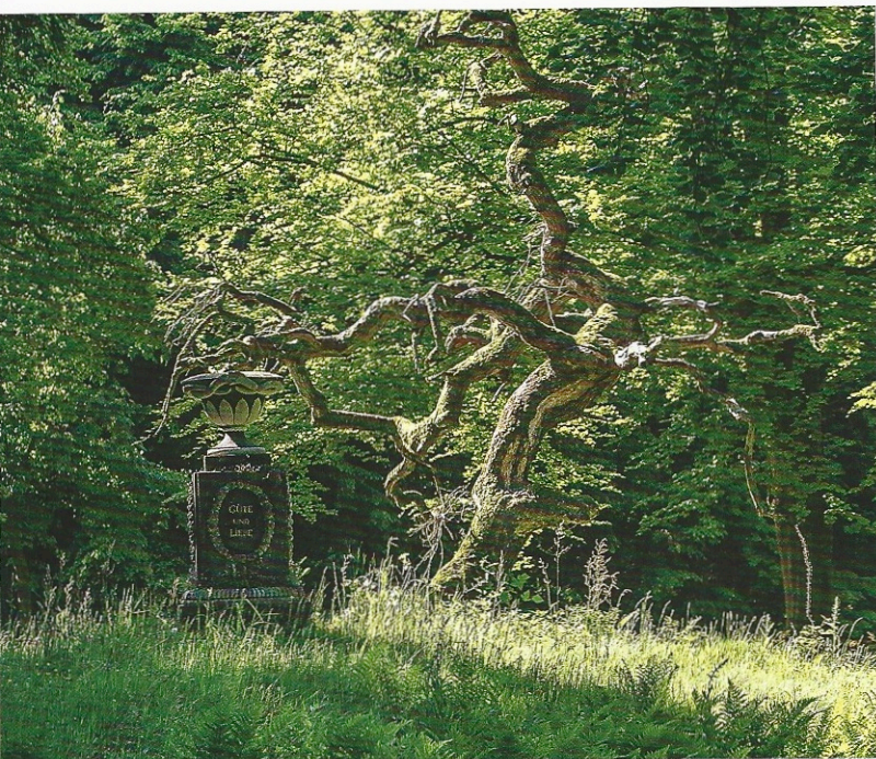
Jahrhundertealte Bäume prägen das Gesicht des Schlossparks, Monumente und Denkmale sind Orte der Erinnerung (Carolineninsel, Foto oben). Holzbrücken führen über Wasserläufe, entlang meterhoher Rhododendren.

Der saure, humusreiche Boden wird durch die Wasserläufe im Park entwässert, es gibt keine Staunässe. Die klimatischen Unterschiede zwischen