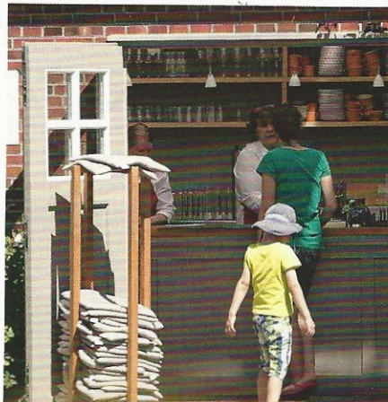
Schlossparkcafé, täglich 11–18 Uhr, Tel.: 049 31/17 50, www.reichshof-norden.de

In einem ehemaligen Gewächshaus des Schlossparks Lütetsburg befindet sich das Schlossparkcafé vor dem Parkeingang. Blickfang und Schattenspender sind die über 50 Jahre alten Rebstöcke, die geschützt in kleinen Steinnischen unter dem Glasdach des alten Gewächshauses wachsen und im Herbst für Fruchtrauben sorgen. Hier oder auf der Außenterrasse schmecken ein herzhafter Imbiss, warmer Klütje, Milchreis, hausgemachter Kuchen und Ostfriesentee mit Kluntje und Sahne.